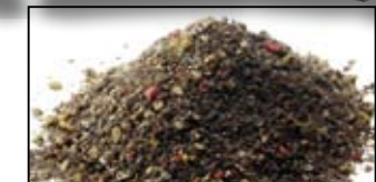
MAGMIX PLUS SPECIAL BLACK - 1KG