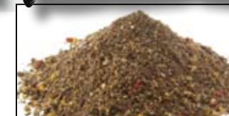
MAGMIX PLUS ACTIVE FEEDER - 1KG