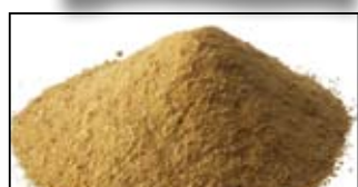
MAGMIX AROMA PLUS CARAMEL SCOPEX - 250G