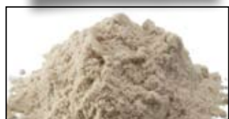
MAGMIX AROMA PLUS DARK CHOCOLATE - 250G