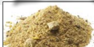
MAGMIX PLUS SCOPEX CARP - 1KG