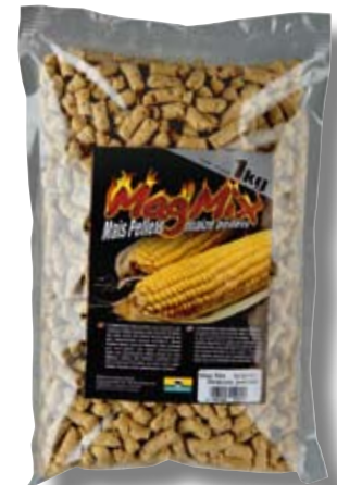
CORN PELLETT 1KG

Az édes, pörkölt kukoricából készült CORMORAN kukorica-pelletet csúzlival vagy kézzel is bejuttathatjuk a szerelékünk köré. Nagyon gyorsan oldódik a vízben és pörkölt kukorica-illata messzire szétterül, odacsalva a keresgélő halakat. Apró darabokra hullik szét a vízben, nem tudnak jóllakni vele. Egy zacskó tartalma: 1kg