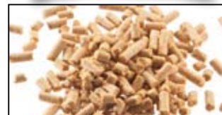
MAGMIX PELLETT MATCH 1KG

Gabonalisztekből és fahéjtartalmú fűszerkeverékből készül. Ideális keszegfélék, bodorka, márna és compó horgászatához. A kis méretnek köszönhetően a MAGMIX fahéjas pelletek az etetőanyagba keverve és horgon feeder-horgászatra is alkalmasak. Oldódás során folyamatos illatfelhő alakul ki. Álló- és folyóvízre egyaránt javasoljuk. Oldódási idő: 10-30 perc