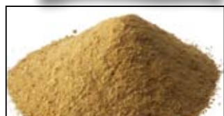
MAGMIX AROMA PLUS CARAMEL SCOPEX - 250G