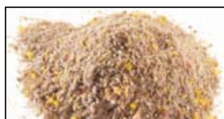
MAGMIX GARDONS - 1KG