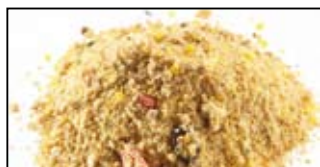
MAGMIX CARPE- 1KG