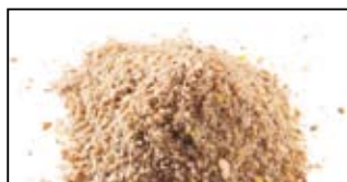
MAGMIX FEEDER 1KG