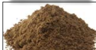
MAGMIX AROMA PLUS GINGER BREAD - 250G