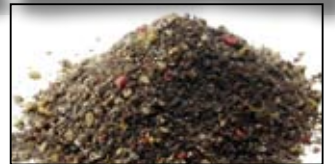
MAGMIX PLUS SPECIAL BLACK - 1KG