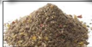
MAGMIX PLUS RIVER SPECIAL - 1KG