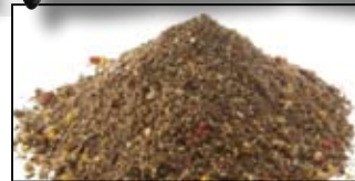
MAGMIX PLUS ACTIVE FEEDER - 1KG