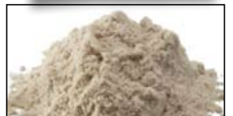
MAGMIX AROMA PLUS DARK CHOCOLATE - 250G