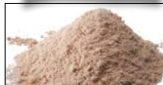
MAGMIX AROMA PLUS TUTTI FRUTTI - 250G