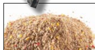
MAGMIX MATCH - 1KG