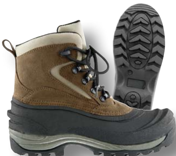
ASTRO-THERMO CHAUSSURES À LACETS 9177