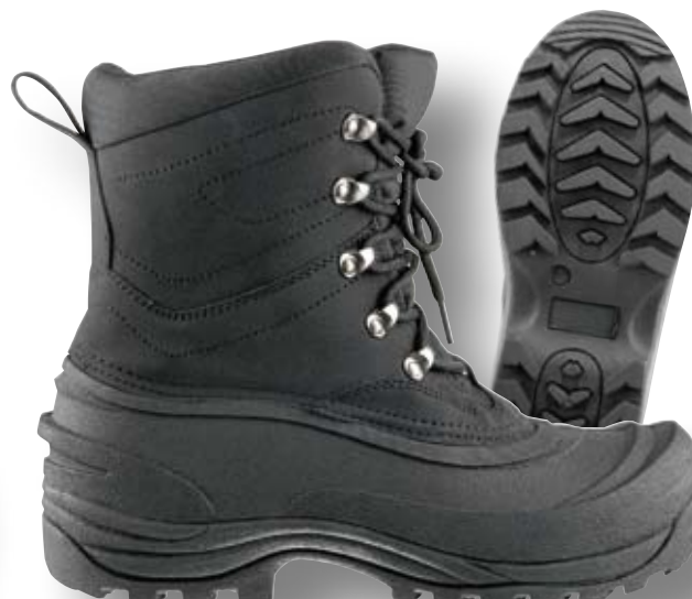
ASTRO-THERMO CHAUSSURES À LACETS 9178